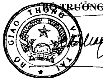
Đinh La Thăng