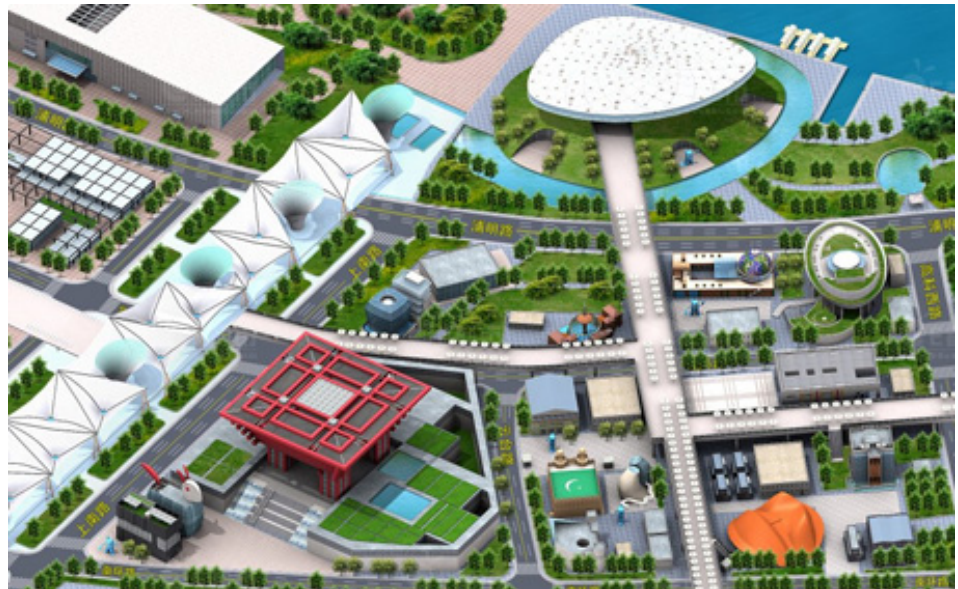
Hình 11-12. Tòa nhà Trung Quốc, điểm nhấn của khu triển lãm.

Tòa nhà có 47 nghìn m 2 trưng bày các nội dung về đất nước, con người Trung quốc, 38 nghìn m 2 giới thiệu các vùng miền đất nước, ngoài ra còn có hơn 3 nghìn m 2 dành cho HongKong, Macao và Đài Loan.