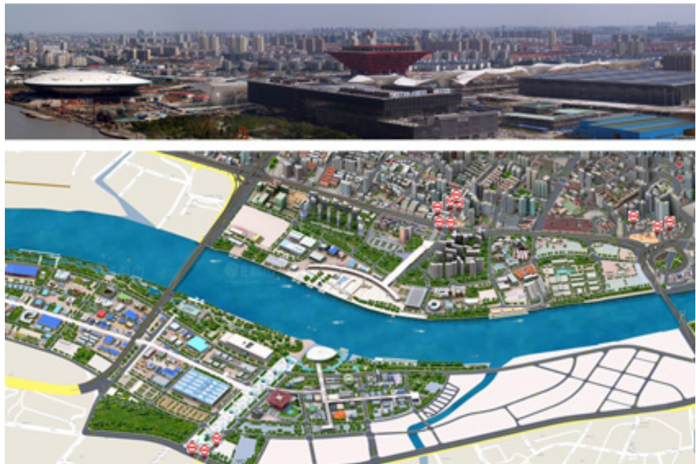
Hình 3. Khu vực triển lãm trong quá trình xây dựng nhìn từ phía bờ Tây.

Trên mặt bằng tổng thể, khu Expo 2010 được tổ chức theo một hệ thống 5 tầng bậc từ lớn đến nhỏ (hình 4), đó là các cấp độ: