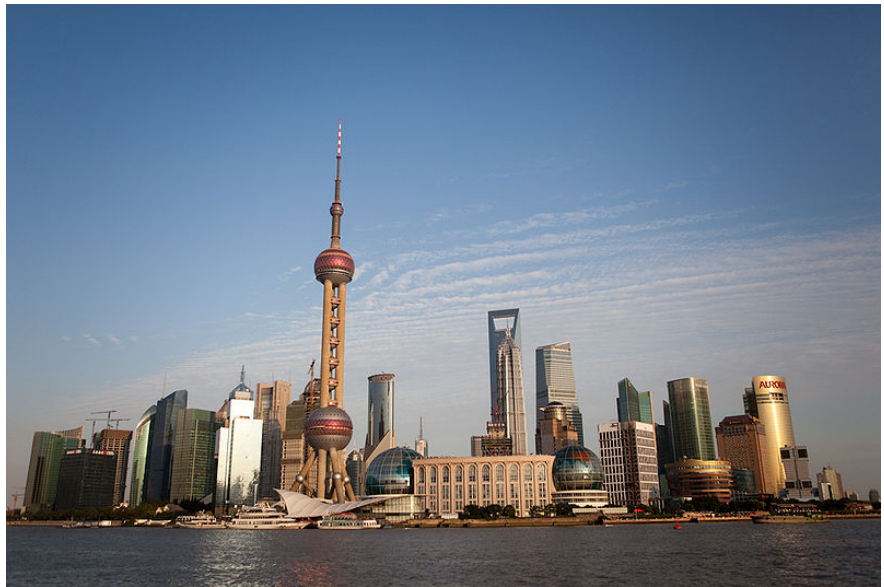
Hình 2. Thượng Hải ngày nay