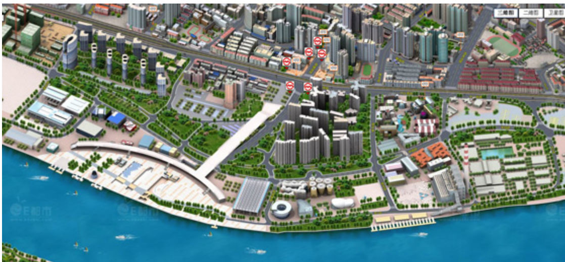
Hình 8. Tổng thể khu triển lãm phía Tây của Expo 2010.

Trong khu Expo 2010 có rất nhiều công trình, tòa nhà triển lãm được xây dựng, từng khối pavilion là một chủ đề được thể hiện bằng những ngôn ngữ kiến trúc từ truyền thống đến hiện đại. Các công trình chính trong khu triển lãm gồm có (Hình 9):