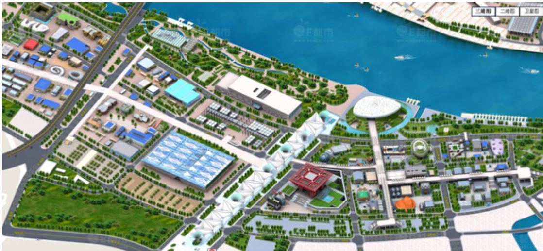
Hình 7. Tổng thể khu triển lãm phía Đông của Expo 2010.