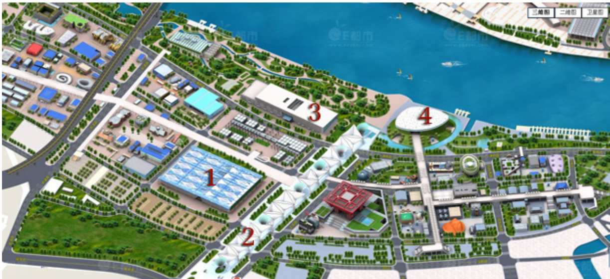
Hình 9. Tòa nhà triển lãm theo chủ đề (1) và Trục đại lộ triển lãm (2)

Trục đại lộ có hệ kết cấu hiện đại dây treo kết hợp màng căng tổng hợp lớn nhất thế giới, có chiều cao 40m. Hệ kết cấu này được thiết kế bởi Cty SBA (Đức) và do hai nhà thầu Knippers Helbig và Shanghai Mechanized Construction thi công, bao gồm 6 “phễu” kết cấu thép + màng căng. Vật liệu màng căng mỏng của mỗi “phễu” cho phép lấy ánh sáng tự nhiên từ trên cao xuống tận không gian đa năng của tầng trệt.