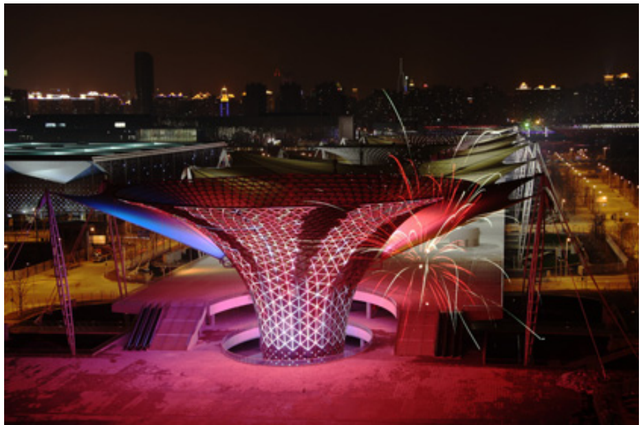
Hình 10. Hệ kết cấu không gian của trục triển lãm Expo.

3. Trung tâm Expo (Expo Centre) , có vị trí sát bờ sông Hoàng phố của khu B, bên cạnh trục đại lộ Expo (ký hiệu số 3). Tòa nhà có chiều dài 350m, kéo dài từ Đông - Tây, và chiều rộng 140m, với diện tích trung bày là 140 nghìn m 2 . Tại đây sẽ diễn ra các buổi lễ tiếp đón, hội thảo, họp báo và các diễn đàn trong suốt thời gian của Expo.